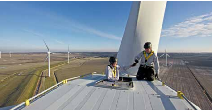
Turnusmäßige optische Inspektion durch ein GP JOULE Serviceteam.

Wir sorgen sowohl auf dem Feld als auch auf dem Papier dafür, dass Ihre Investition wächst und gedeiht. Durch ein permanentes Controlling und unser wirtschaftliches Know-how stellen wir sicher, dass Ihr Projekt attraktive Renditen erwirtschaftet und Ihr Kapital nachhaltig verwaltet wird. Mit dem Service der kaufmännischen Betriebsführung betreuen wir für Sie unter anderem folgende Bereiche: