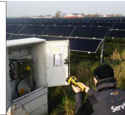
Im Falle von erhöhten Temperaturen können wir direkt vor Ort mit der Ursachenforschung und Problembeseitigung beginnen.