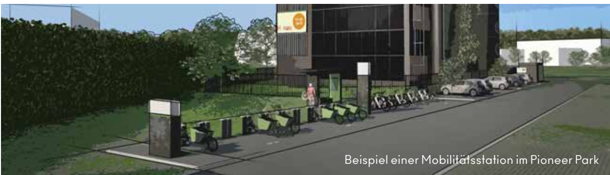
Beispiel einer Mobilitätsstation im Pioneer Park

Elektromobilität gehört zu den heutigen Megatrends: Studien prognostizieren für 2030 einen E-Auto-Anteil von mindestens 30 Prozent in Deutschland. Eine Wohnung ohne Lademöglichkeit wird künftig genauso unattraktiv erscheinen wie eine Wohnung ohne Internetanschluss. Auch der Trend Sharing Economy hält Einzug in der Wohnungswelt: Die Mobilität von morgen bedeutet, Dinge nicht mehr zu besitzen, sondern an ihnen teilzuhaben. Das Angebot von Lademöglichkeiten und Sharing-Systemen wird somit zum wichtigen Wettbewerbsfaktor. Mieter wie Käufer werden durch innovative Mehrwerte angezogen.