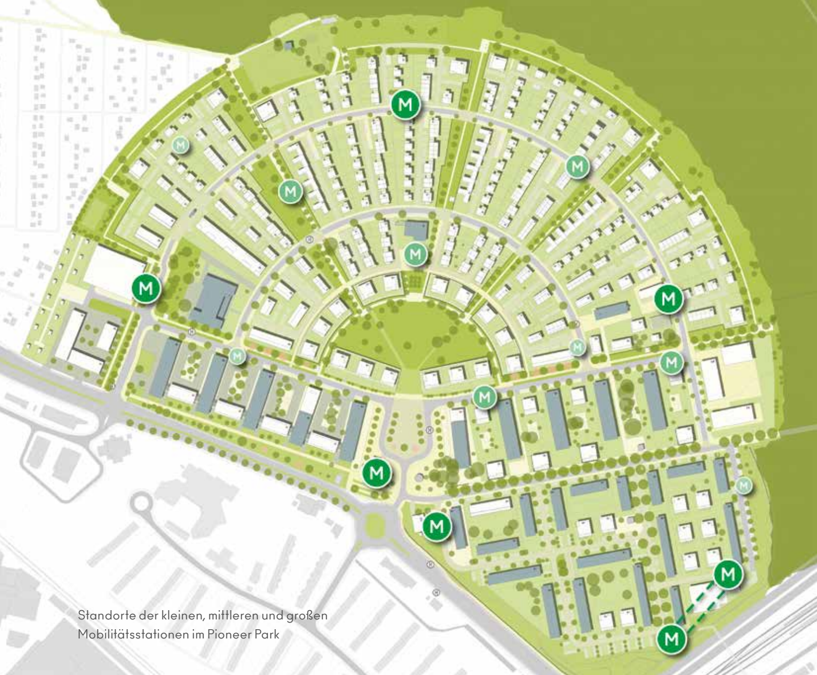
Standorte der kleinen, mittleren und großen Mobilitätsstationen im Pioneer Park